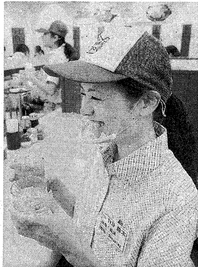
①透明で、顔の表情が見えるのが特徴の「マスクリア」 ②透明のマスクを着用して接客する従業員 ＝ペッパーランチ横浜ポルタ店